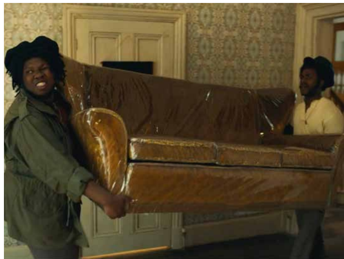
Still från Lovers Rock (2020) / Still from Lovers Rock (2020)

Sound systems are built to play bass heavy music, they are designed, engineered and spatialised to allow audiences to not only hear but to feel music by immersing the body in low-frequency bass. Sound systems also consist of crews, who not only design and build equipment but develop skilled techniques through playing records and MCing. Deng Deng HiFi specially installed their sound system at Smedjan and carefully selected tracks from late 60's ska and rocksteady up until today's dub and steppers. As they outlined, their bass heavy selection is a 'conscious music with a clear message. No slackness or glorification of violence or degrading of women. Only good vibes and upliftment of the people.'