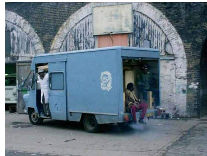
Stills från Babylon (1980) / Stills from Babylon (1980)

Through the making of sound systems, bass cultures have been important in the development of underground musical genres from Reggae, Dub and Ska to Hip-Hop, Techno, Jungle and many more. Bass Cultures, How Low Can You Go! was a program of events supported by musicians, DJs, and makers that in their own way have contributed and played an important role in the development of bass culture, through the making of sound systems, the organising of underground music and club culture in Sweden and beyond. Over two days the event hosted film screenings, workshops, talks and DJ sets to showcase bass and sound system cultures, their creativity, history, and relevance today. The following text provides an overview of the programme and complimentary texts introduce and frame the individual events.