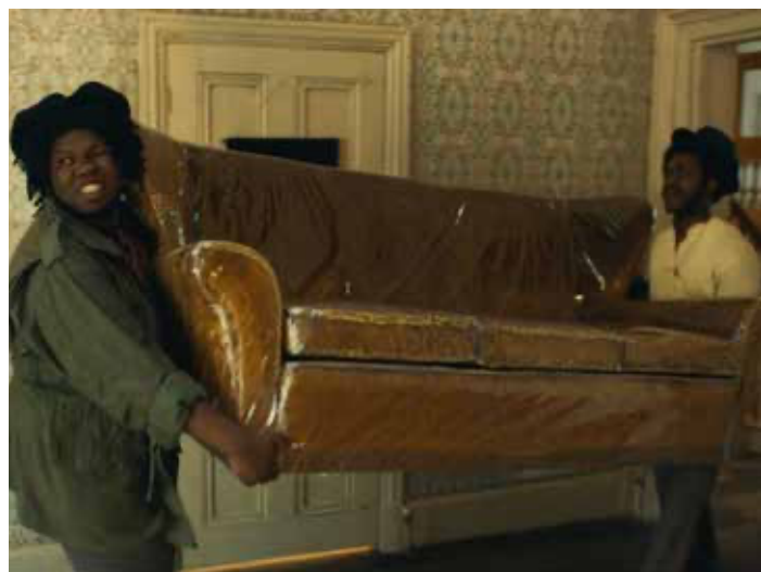
Still från Lovers Rock (2020) / Still from Lovers Rock (2020)

Sound systems are built to play bass heavy music, they are designed, engineered and spatialised to allow audiences to not only hear but to feel music by immersing the body in low-frequency bass. Sound systems also consist of crews, who not only design and build equipment but develop skilled techniques through playing records and MCing. Deng Deng HiFi specially installed their sound system at Smedjan and carefully selected tracks from late 60's ska and rocksteady up until today's dub and steppers. As they outlined, their bass heavy selection is a 'conscious music with a clear message. No slackness or glorification of violence or degrading of women. Only good vibes and upliftment of the people.'