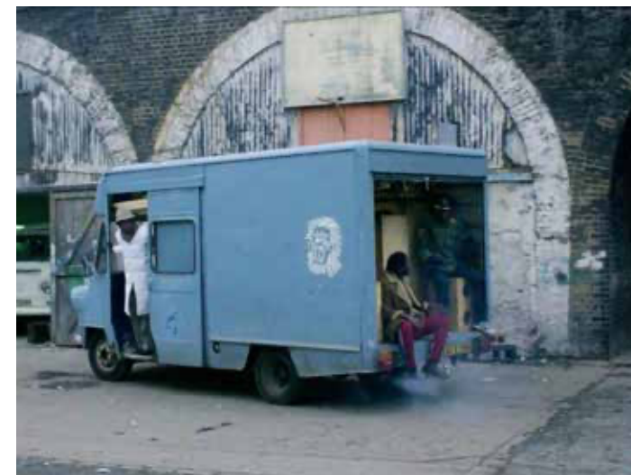
Stills från Babylon (1980) / Stills from Babylon (1980)

Through the making of sound systems, bass cultures have been important in the development of underground musical genres from Reggae, Dub and Ska to Hip-Hop, Techno, Jungle and many more. Bass Cultures, How Low Can You Go! was a program of events supported by musicians, DJs, and makers that in their own way have contributed and played an important role in the development of bass culture, through the making of sound systems, the organising of underground music and club culture in Sweden and beyond. Over two days the event hosted film screenings, workshops, talks and DJ sets to showcase bass and sound system cultures, their creativity, history, and relevance today. The following text provides an overview of the programme and complimentary texts introduce and frame the individual events.